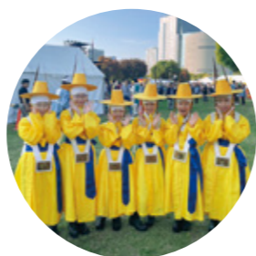
ブンルムクラブ 練習日 火曜日