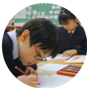
カラーリングクラブ