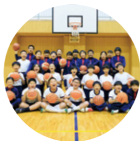
バスケットクラブ 練習日 木曜日