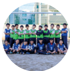
サッカークラブ 練習日 水曜日