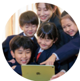
プログラミングクラブ