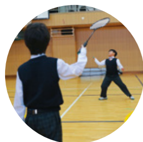
アクティブクラブ