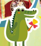
フアイト! フアイト!