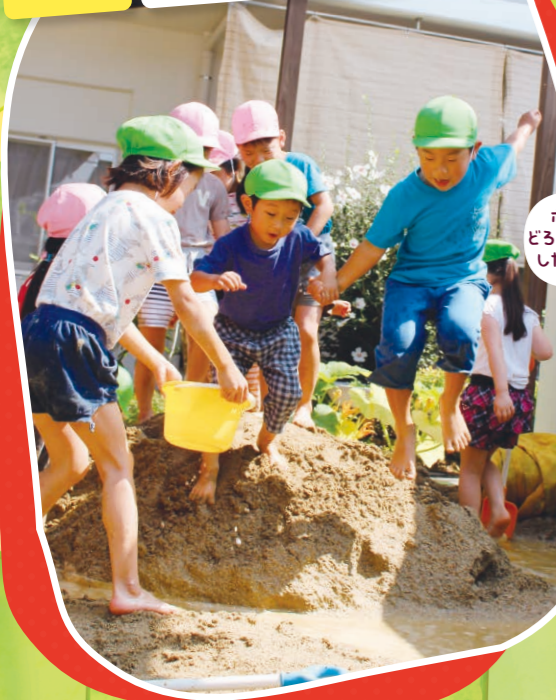
ポグも どろんこ遊び したいな!