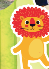
みんな 元気に できるかな?