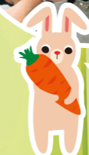
ワタシの にんじんと 交換しない?