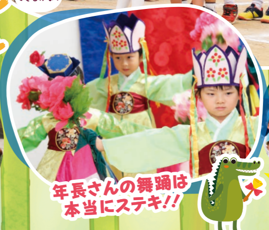
年長さんの舞踊は 本当にステキ!!