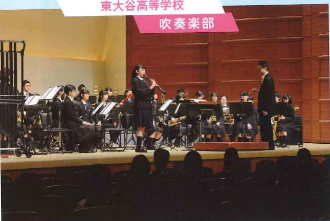
東大谷高等学校 吹奏楽部

▲2日目オープニングのファンファーレを担当した同校は、ジャズの名曲として愛される『シングシングシング』と、アニメ史上に輝く名作のメドレー『ジャパニーズ・グラフィティⅫ』を演奏。部員が次々とソロパートを披露するなど、動きに富んだステージ構成で観客を釘付けに。