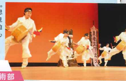
建国中学校高等学校

▶韓国珍島に伝わる太鼓の踊り「珍島ブッリ」。巧みなバチさばきと、跳ねるように動いたかと思えば次の瞬間には静止する、華麗な足さばきが見事に融合したステージは、まさに泣く子も黙る迫力! 勇壮なリズムを刻む太鼓の音が心地よく心と体に響き渡る。