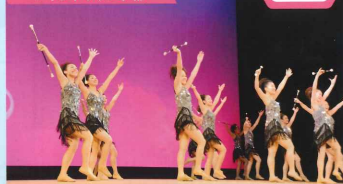
四條畷学園高等学校 バトントワリング部

▲「どこにでもいる女子高生が、きらめく衣装に着替え、バトンを持ち、舞台上立つと、グルーヴィなダンサーへと変身!」というメッセージとともに繰り広げられた「O.K. Everybody! Let's sing and dance!!」。リズムカルなステップと華麗なバトンさばきに誘われるように、会場からは自然と手拍子が沸き起こった。