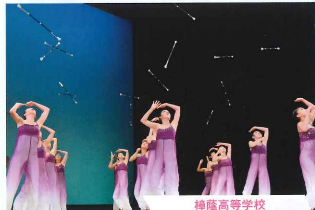
樟蔭高等学校 バトントワリング部

▲「魏志倭人伝」の世界観を表現した『倭～yamato～』。確かなバトンさばきと流れるような隊形移動で観客を惹きつけた。