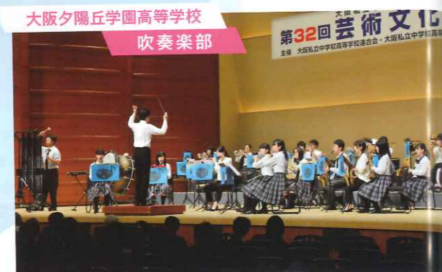
大阪夕陽丘学園高等学校 吹奏楽部

▲THE SQUAREの『オーメンズ・オブ・ラブ』、DA PUMPがカバーして話題になった『U.S.A.』と、アップテンポなナンバーを選曲。『U.S.A.』は文化祭でも盛り上がった曲。楽しんで聞いてもらえたらうれしいです! (部員)