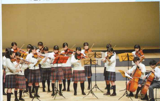
関西創価中学校高等学校 オーケストラ部

▼ホルストの楽曲の中でも親しみやすい『セントボール組曲』から、リズムカルで活発な第1楽章、同じ旋律をくり返しながらフィナーレに向かう第4楽章を披露。さまざまな楽器の音色や全く異なるメロディーが重なり合っていく、奥行きを感じられるハーモニーが響き渡った。