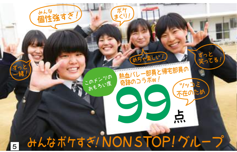
5 みんなボケすぎ！NONSTOP!グループ