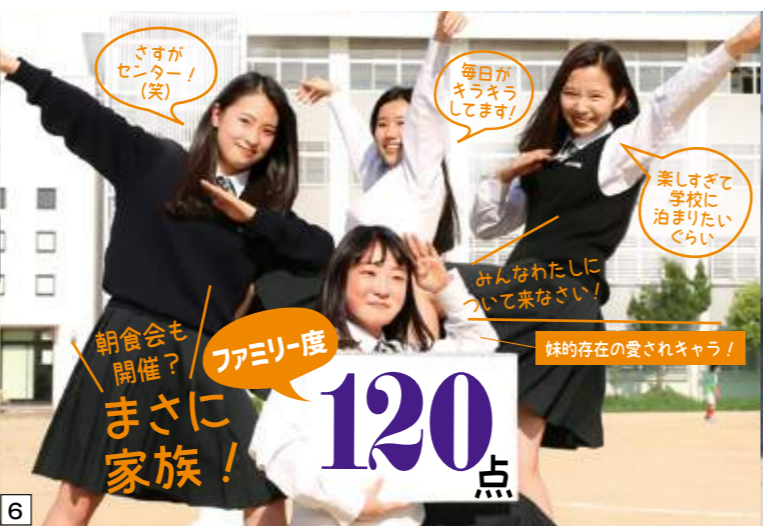
6 ファミリー度 まさに家族！