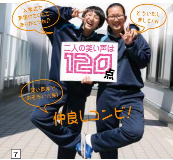
7 入学式で声掛けてくれてありがとうね！ 仲よしコンビ！