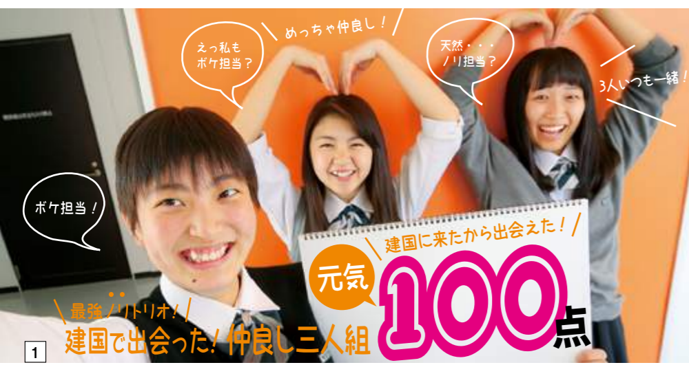
1 最強ノリドリオリ！ 建国で出会った！仲よし三人組

みんな仲よし！みんながライバル！アットホームな本校だからいろいろな好得点が見つかるはず！ みんなの笑顔と和気あいあいとした雰囲気はまさに建国だから得られた宝物です！