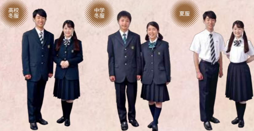
高校生はホワイトとネイビーの落ち着いたストライプのネクタイとリボン 中学生はターコイズブルーに赤いラインが映えるストライプのネクタイとリボン 夏服は清潔感重視の爽やかスタイルです！

建国の制服は知的で爽やかシンプルなデザインが特長です。格調高いエンブレムや大きめのストライプをあしらったネクタイとリボンがポイントとなり華やかさを演出、スタイリッシュなスーツタイプの制服です。