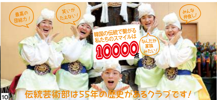
10 伝統芸術部は55年の歴史があるクラブです！