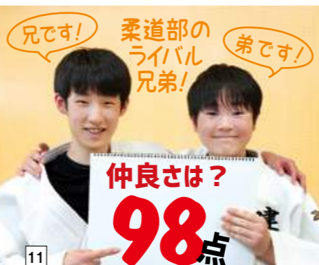
11 兄弟！ 兄弟！