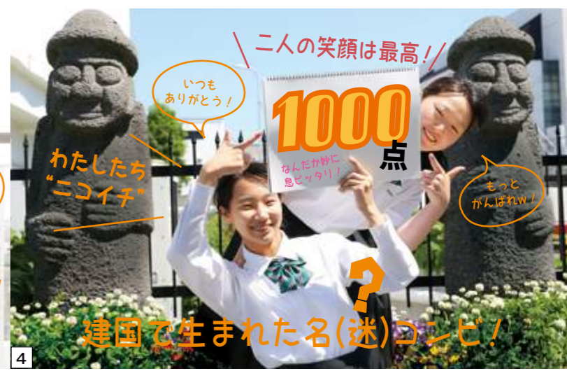
4 建国で生まれた名(迷)コンビ！