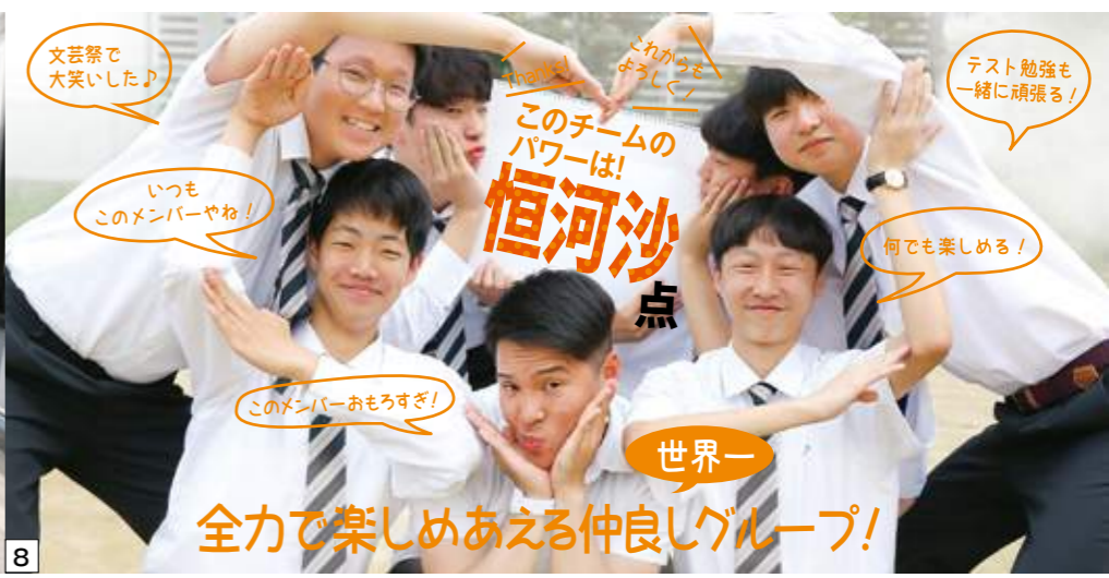
8 世界一 全力で楽しめあえる仲よしグループ！