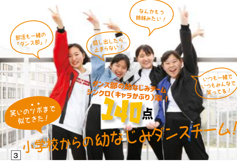
3 小学校からの幼なじみダンスチーム！