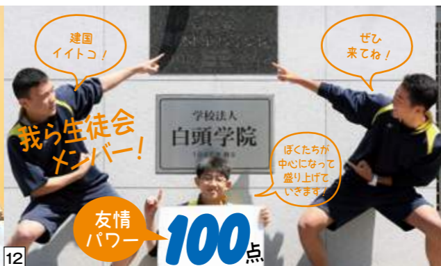
12 友情パワー 100点