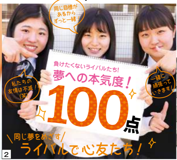
2 同じ夢をめざす/ ライバルで心友たち！