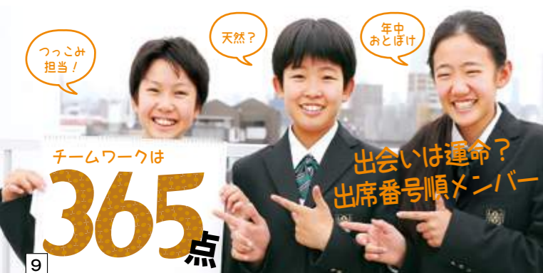
9 チームワークは365点